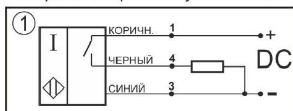
Цоколевка клеммной колодки